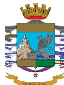
Guardia di Finanza